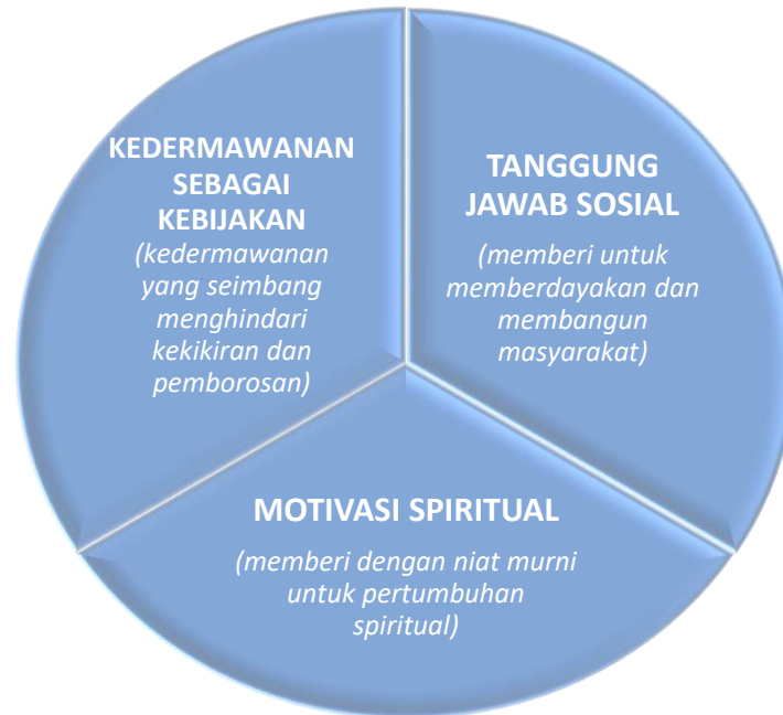
Gambar 1. Prinsip Kedermawanan Ibn Miskawayh