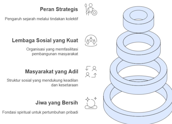
Gambar 2. Piramida Tranformasi ZISWAF Piramida Transformasi ZISWAF

Akhirnya, ZISWAF bukan hanya bagian dari ibadah atau etika individual, tetapi merupakan fondasi penting dalam pembangunan peradaban Islam. Dengan jiwa yang bersih, masyarakat yang adil, dan lembaga sosial yang kuat, umat Islam akan mampu bangkit dan memainkan peran strategis dalam sejarah. Ibn Miskawayh menempatkan ZISWAF sebagai kekuatan transformatif yang bermula dari hati, tetapi berdampak hingga struktur sosial dan budaya umat.